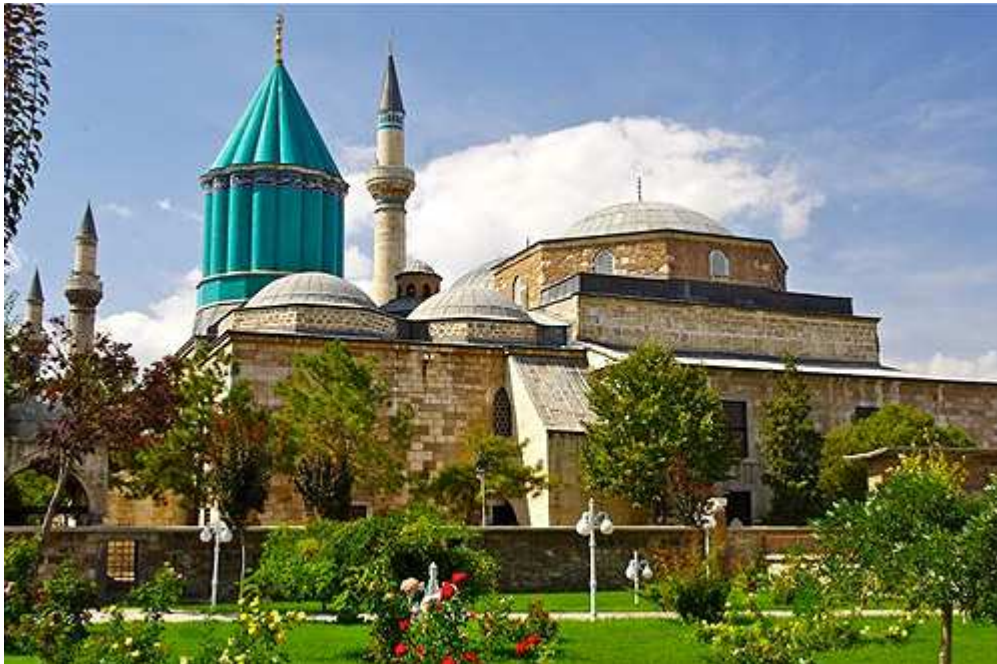
Mausoleo del Mevlana Rumi, en Konya, Turquía, visitado por millones de personas cada año.

sufismo respecto de los enfoques teológicos e intelectuales de su época, al dar una respuesta al significado de la vida (Arazteh, 1976).