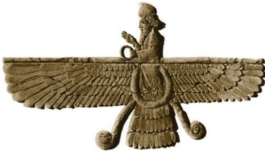
Ahura Mazda, de Mazdeïsche god van licht werd op deze manier afgebeeld in het paleis van Darius, zesde of vijfde eeuw v.Chr. Louvre.